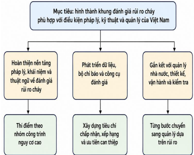
Hình 3: Khung giải pháp hoàn thiện đánh giá rủi ro cháy tại Việt Nam.

Thứ sáu , triển khai lộ trình thí điểm theo ba bước: xây dựng bộ tiêu chí mẫu; áp dụng thử nghiệm đối với một số loại hình có nguy cơ cao như nhà ở kết hợp sản xuất, kinh doanh, nhà ở nhiều tầng nhiều căn hộ, nhà chung cư, nhà cao tầng hỗn hợp, cơ sở sản xuất và kho trong khu dân cư; sau đó đánh giá, hiệu chỉnh và ban hành hướng dẫn áp dụng rộng rãi.